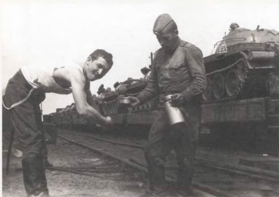
На привале. Середина 70-х.