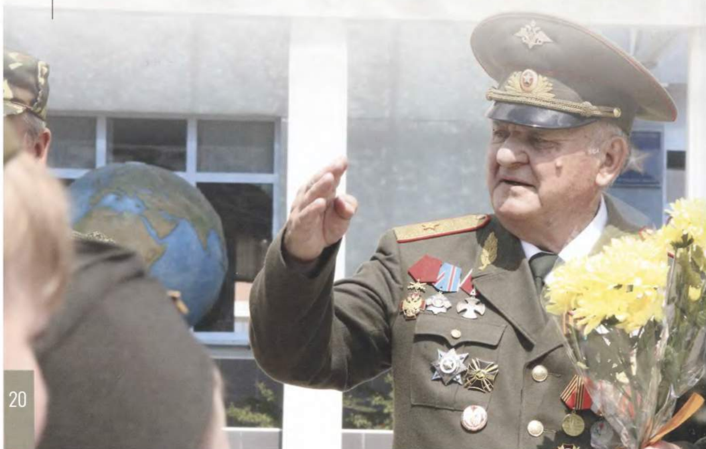
21 С друзьями и соратниками. Ростов-на-Дону. 2007 г.