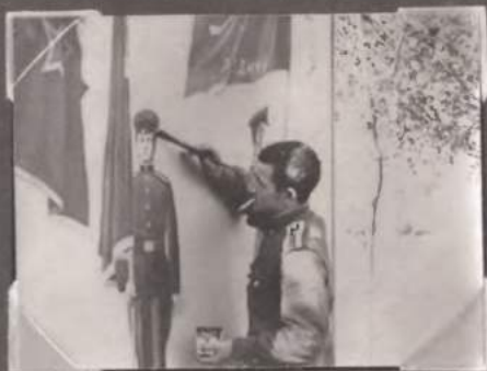
Формирую списки на сиротском плацу...