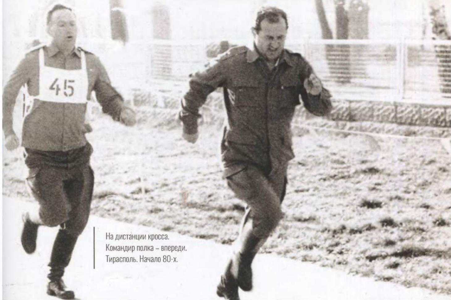
На дистанции кросса. Командир полка – впереди. Тирасполь. Начало 80-х.