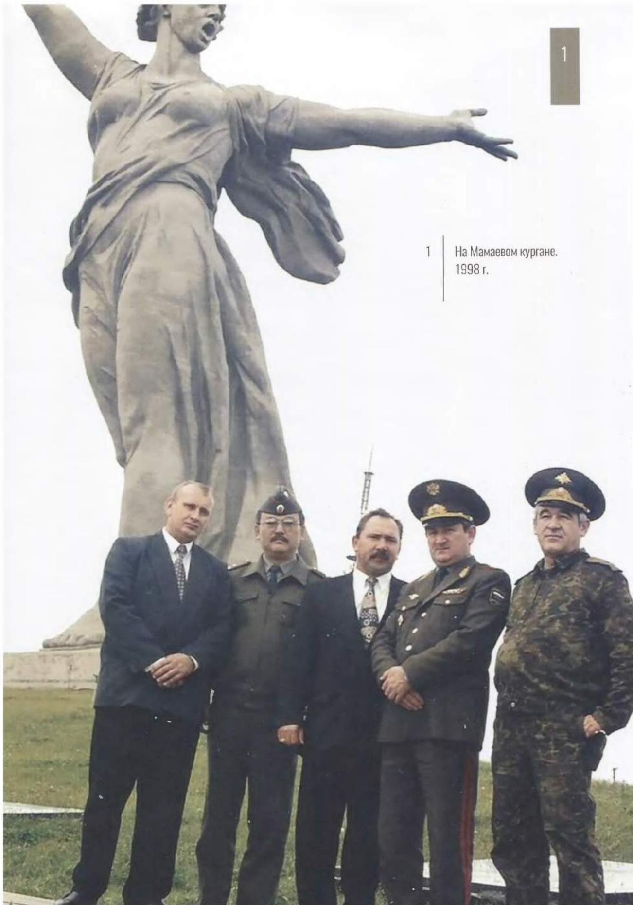
1 На Мамеевом кургане. 1998 г.