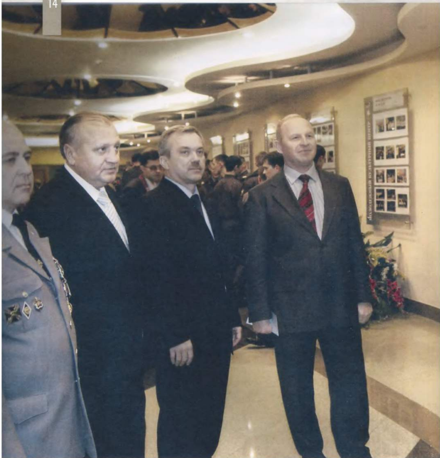
14 | Белгород. 2003 г.