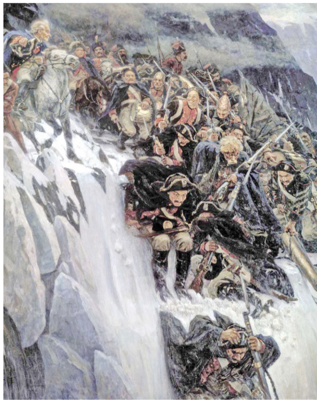
Автор: Василий Иванович Суриков Годы жизни: 1848–1916 Произведение: «Переход Суворова через Альпы в 1799 году»

Художник Василий Суриков изобразил один из самых драматических моментов: переход через заснеженный хребет Паникс. Эта картина занимает особое место в творчестве Сурикова. Смысл происходя-